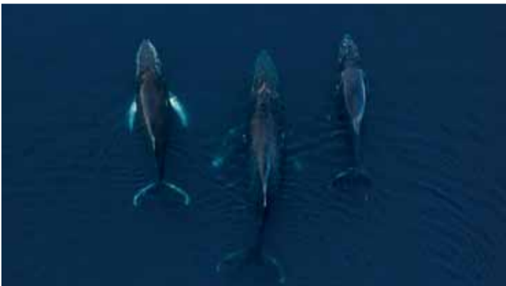
Vráskavce dlhoplutvé v Antarktíde.