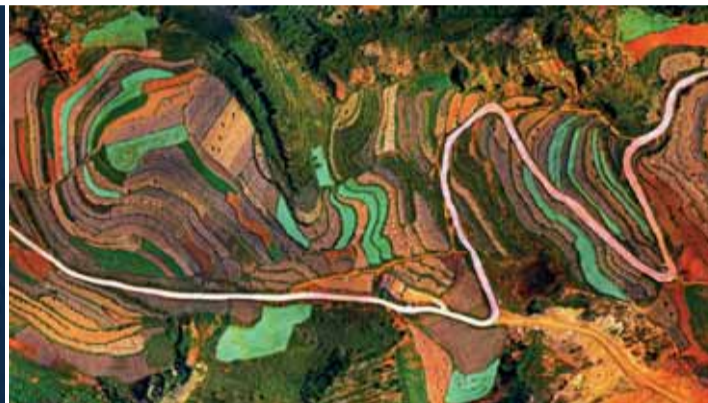
Pestrofarebné údolie Luoxiagou v Číne.