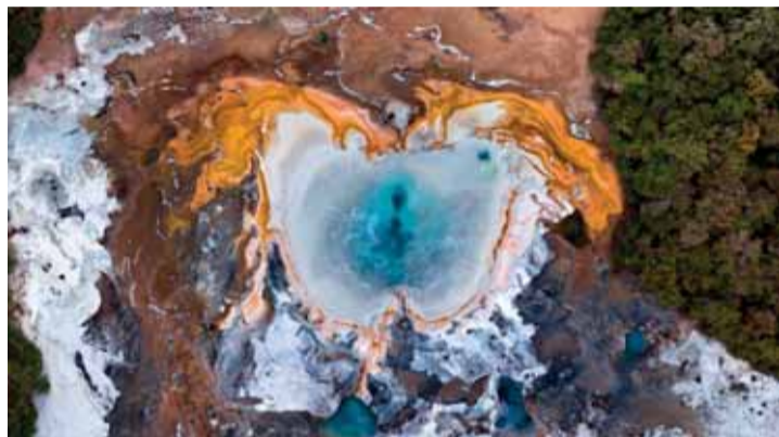
Horúce pramene Orakei Korako na Novom Zélande.

že išlo o anonymné hlasovanie a porota nevedela koho sú fotografie, ktorým dala hlas.“ vyjadril sa Kulišev. Fotograf je držiteľom aj najvyššieho titulu Fellowship od Britského inštitútu profesionálnych fotografov (FBIPP) a mnohých ďalších významných ocenení. V roku 2012 bol vybraný aj do elity svetových fotografov s výberom ich 151 najlepších fotografií sveta, ktoré sú súčasťou publikácie International Masters of Photography. ik